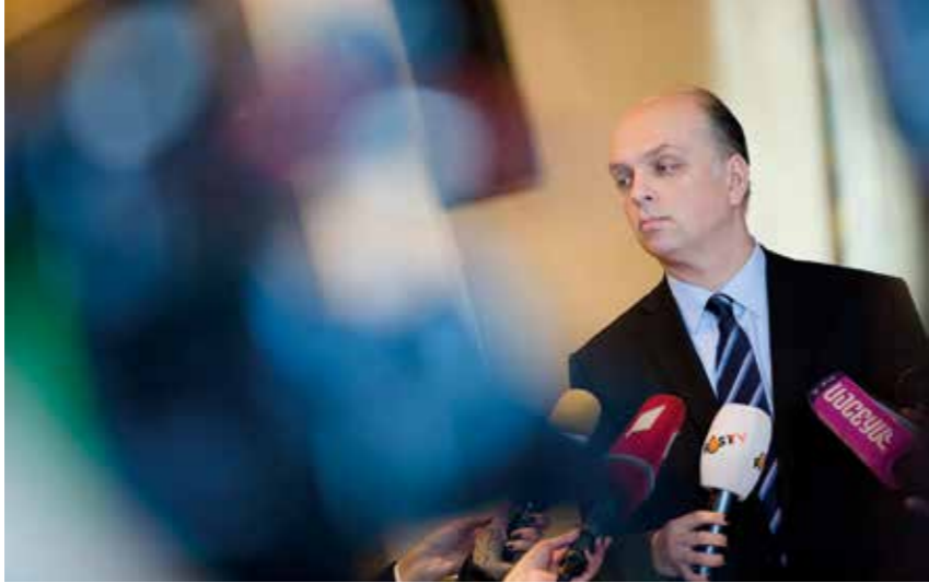
გიორგი ჭირაქაძე საქართველოს ბიზნეს ასოციაციის პრეზიდენტი

დოკუმენტებით, ძვირფასო ნევრებო, ხელისუფლების წარმომადგენლებო და პარტნიორებო. წარმოგედგინეთ საქართველოს ბიზნეს ასოციაციის 2017 წლის ანგარიში. ანგარიშში გაეცნობით, რა მთავარი სა-მუშაოები გასწია ასოციაციამ ნევრების ინტერესების დაცვის, ადვოკატირების, სოციალური პასუხისმგებლობის თუ ორგანიზაციული ზრდის მიმართულებებით და რა შედეგებს მიაღწია ბიზნესგარემოს გაუმჯობესების თვალსაზრისით.